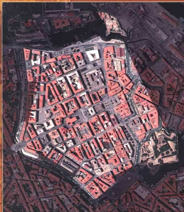
Foto aerea del centro storico.